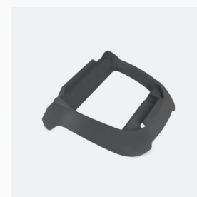
Base per scatola di comando