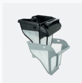
Cestello filtrante Filtro a due stadi: 150/60 µ