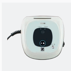
Quadro di comando